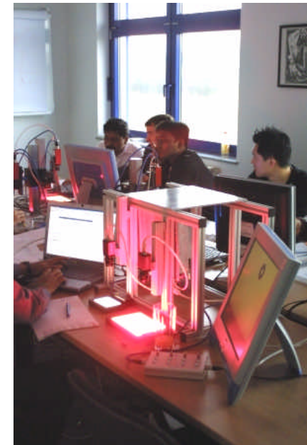
Praktisches Arbeiten und Vorführungen machen Optik und Beleuchtung greifbar.

Grundkenntnisse aus Optik und Beleuchtung sind von Vorteil aber nicht nötig.