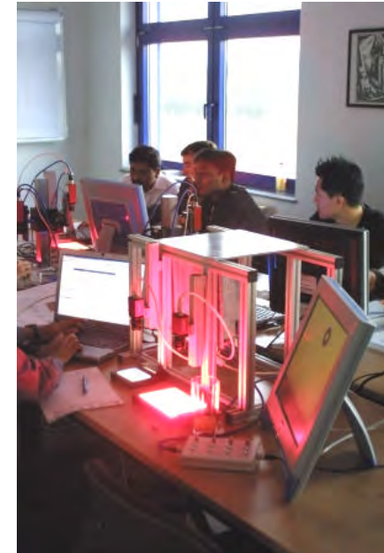
Bestandteil der Branchenschulung „Glas“ sind Vorführungen, Anwendungsbeispiele sowie die Möglichkeit, mitgebrachte Teile zu untersuchen.

Grundkenntnisse zur Bildverarbeitung sind von Vorteil aber nicht Bedingung.